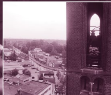
De toren met carillon en het uitzicht richting Eindhoven.