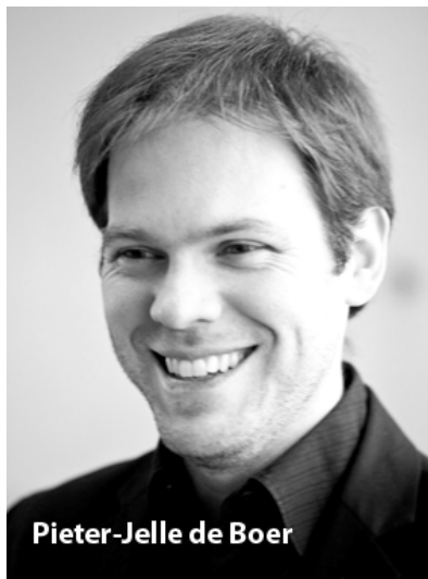
Pieter-Jelle de Boer

Pieter-Jelle de Boer trok in 2010 de aandacht van de muziekwereld door het winnen van de hoogste onderscheiding bij het Antonio Pedrotti dirigentenconcours in Trento, Italië. Hij treedt regelmatig op als gastdirigent bij onder meer het Orchestre Philharmonique Royal de Liège, het Nederlands Symfonieorkest en het Orchestre National Bordeaux-Aquitaine, waaraan hij van 2009 tot 2012 als assistent-dirigent verbonden was. Daarnaast dirigeerde hij onder meer het SWR Sinfonieorchester Baden-Baden und Freiburg, het Orchestra Haydn di Bolzano e Trento, het Orchestre National du Capitole de Toulouse, het Orchestre de Bretagne en het Staatsorchester Braunschweig. Hij werkte met gerenommeerde solisten als Pieter Wispelwey, Alena Baeva, Thierry Escaich, Béatrice Uria-Monzón en de jonge opkomende tenor Michael Fabiano. Met violiste Tianwa Yang nam hij voor Naxos de zelden gespeelde vioolconcerten van Mario Castelnuovo-Tedesco op. Zijn bijzondere affiniteit met de menselijke stem en het vocale repertoire leidde tot een vruchtbare samenwerking met het Parijse kamerkoor Accentus; een onlangs uitgekomen opname met koorwerken van Janáček kreeg lovende kritieken in Franse en internationale media.