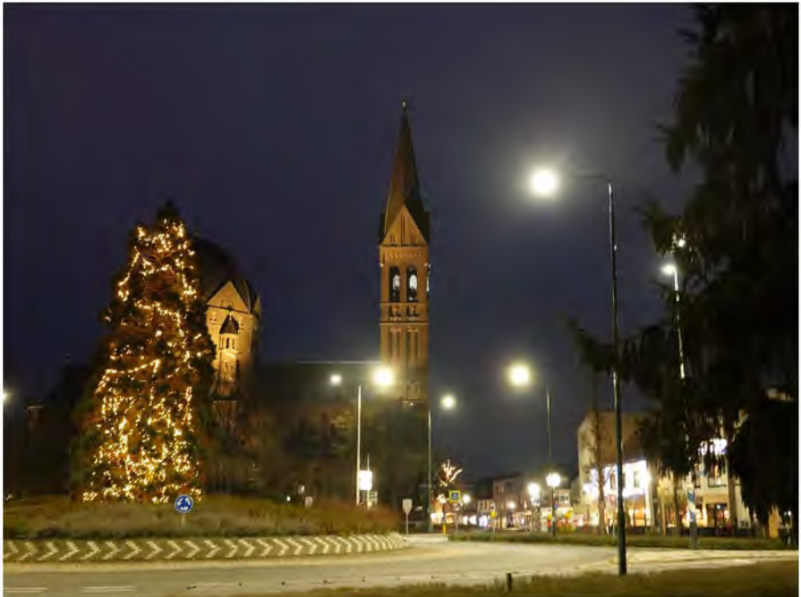
Foto: De H. Brigidakerk in Geldrop vanuit het noorden op zondag 11 december 2022

De huidige parochiekerk is gebouwd op de plaats van de middeleeuwse dorpskerk. Het oude kerkgebouw werd in 1887 gesloopt. Het orgel werd elders in Geldrop opgeslagen. In 1888 stortte tijdens een hevige storm ook de oude alleenstaande toren in. Architect Ch. Weber stelde een plan op voor een geheel nieuwe kerk. Op 3 augustus 1891 kon de kerk worden geconsacreerd.